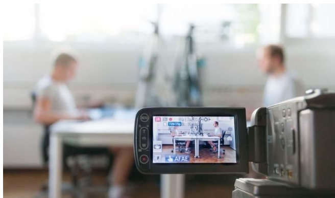
Abb. 1 Beobachtung der Körperhaltung von zwei Teilnehmern beim Bearbeiten einer CAD-Aufgabe

Die Teilnehmer erhielten eine standardisierte und randomisierte CAD-Aufgabe, die unter Beobachtung mit einem herkömmlichen Aufbau bestehend aus Tastatur und Maus in NX 10 zu lösen war. Nach einer einwöchigen Schulung mit einer bereitgestellten 3D-Maus wurde eine zweite, ähnliche Aufgabe gestellt, die die Teilnehmer mit einer 3D-Maus lösen sollten. Der Schwierigkeitsgrad der beiden Aufgaben war vergleichbar, für die Lösung waren aber andere Werkzeuge erforderlich. Während der Aufgabenbearbeitung wurden alle Bewegungen und Klicks mit der Maus aufgezeichnet und die Körperhaltung beobachtet (siehe Abb. 1 und 2).